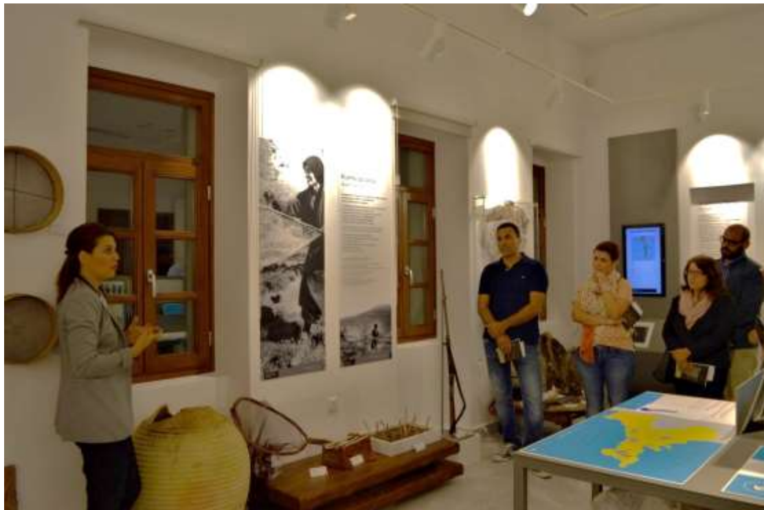
Εικόνα 5, αίθουσα Πέτρας και τοπικών προϊόντων