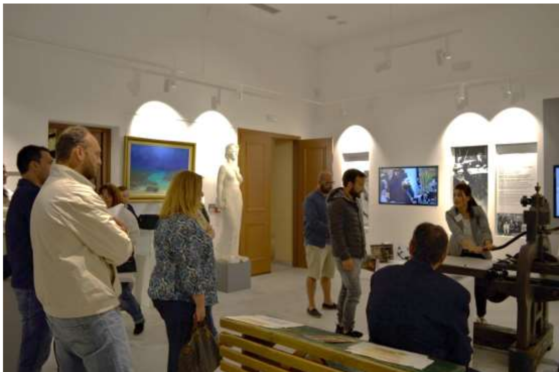
Εικόνα 6, αίθουσα Παρθεναγωγείο και Γύθειο