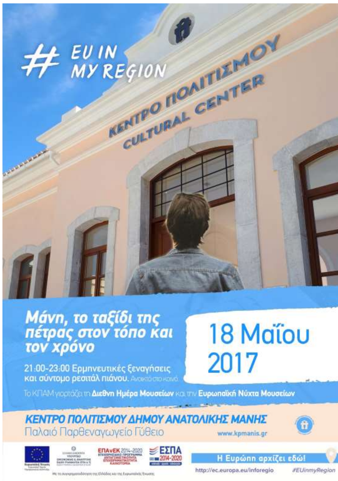
Εικόνα 1, αφίσα συμμετοχής του Κέντρου Πολιτισμού Δήμου Ανατολικής Μάνης