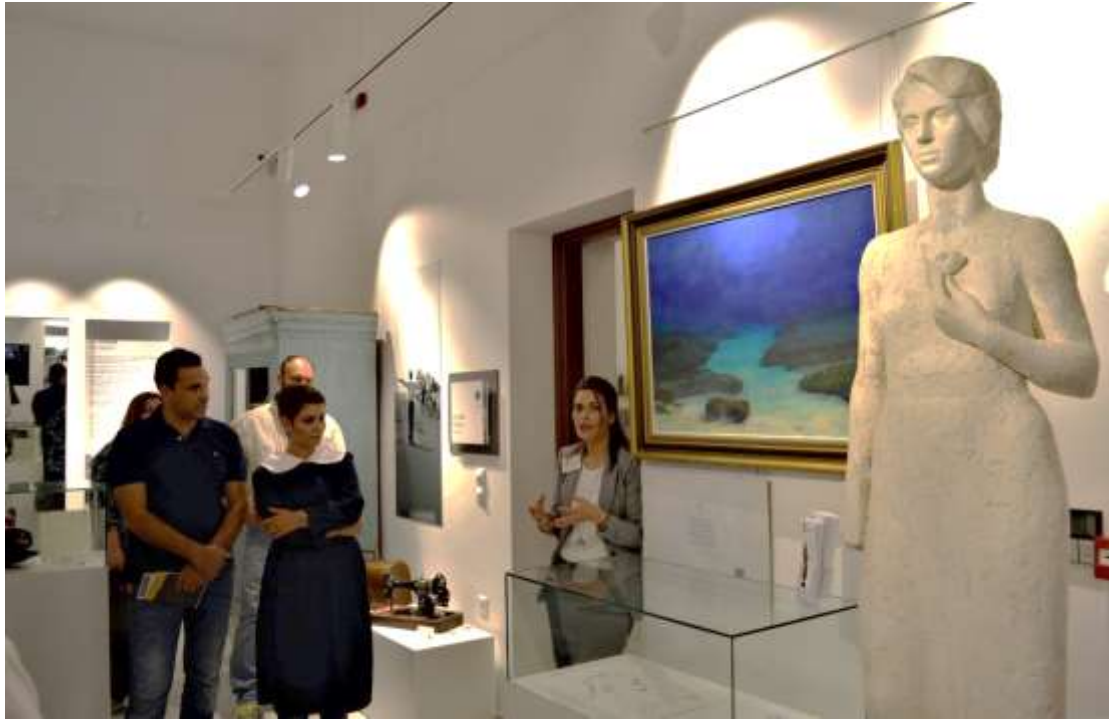
Εικόνα 7, αίθουσα Παρθεναγωγείο και Γύθειο