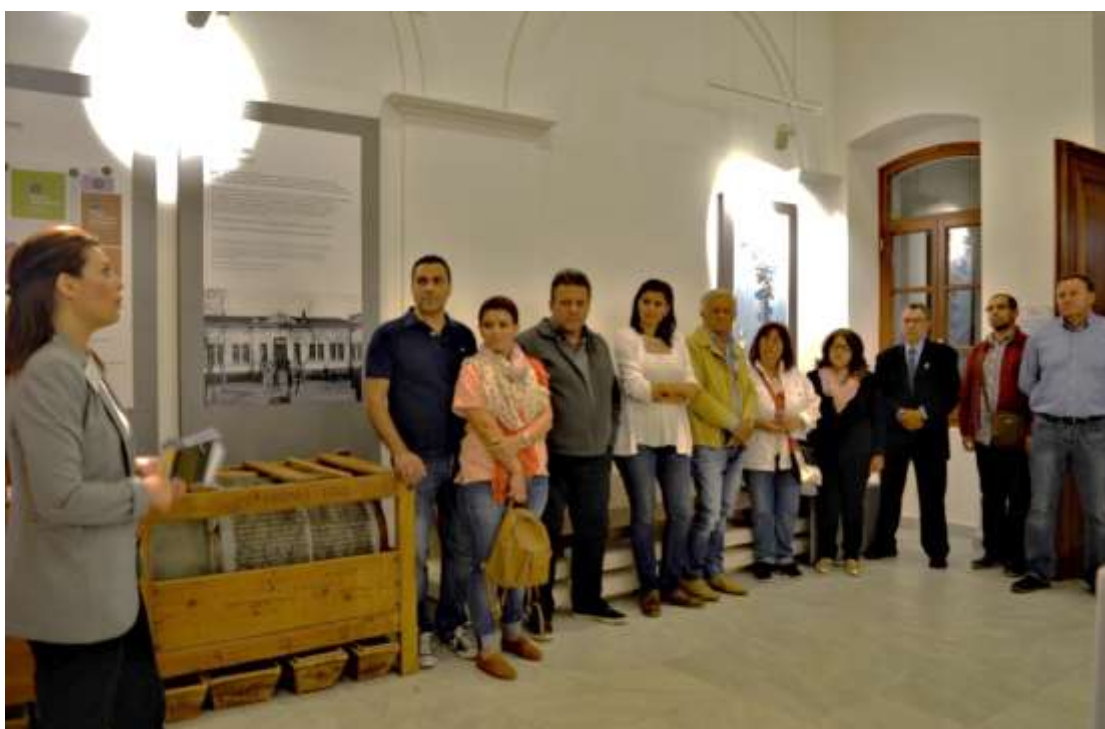
Εικόνα 4, υποδοχή συμμετεχόντων