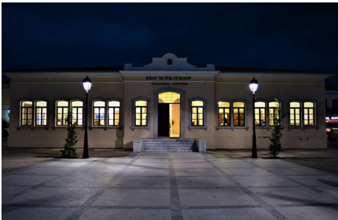
Εικόνα 3, είσοδος Κέντρου Πολιτισμού Δήμου Ανατολικής