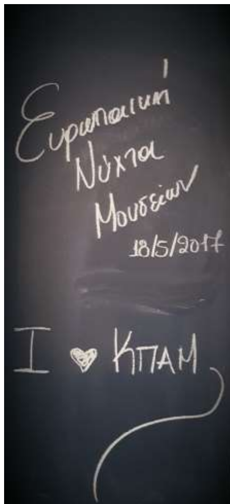
Εικόνα 10, αίθουσα Η Μάνη Σήμερα