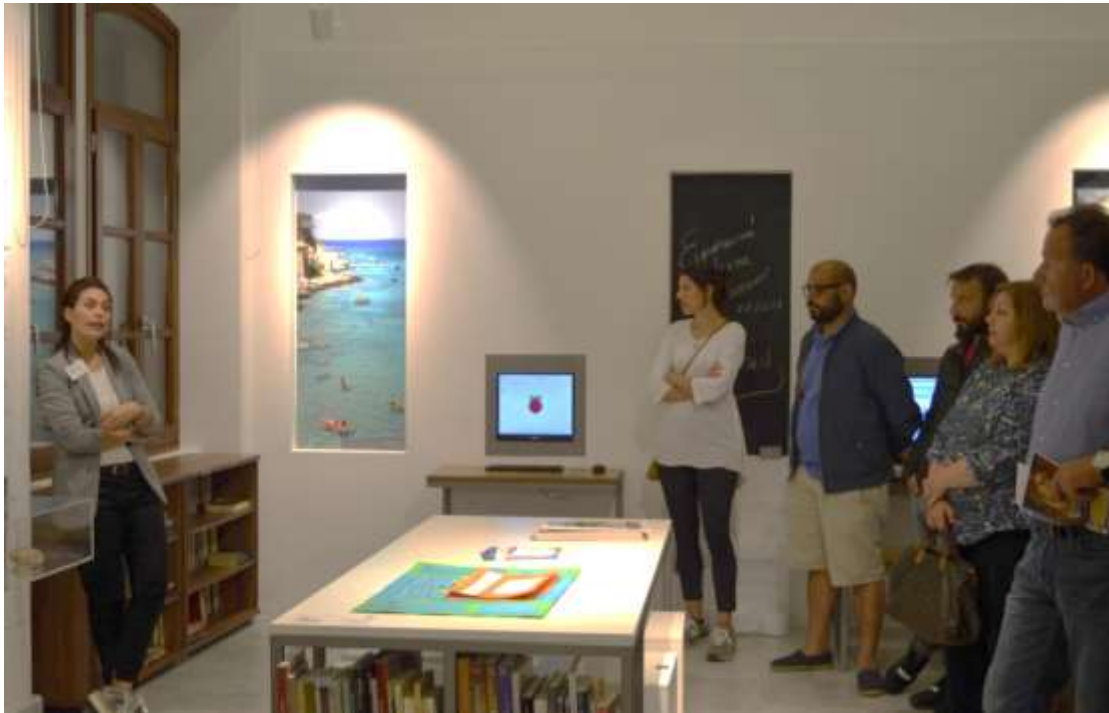
Εικόνα 8, αίθουσα Η Μάνη Σήμερα