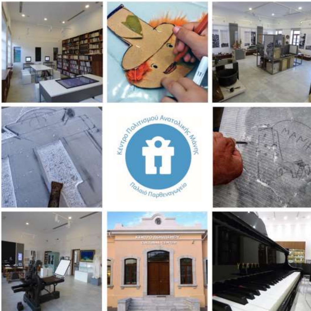
Εικόνα 2, Προωθητικό υλικό του Κέντρου πολιτισμού Δήμου Ανατολικής Μάνης